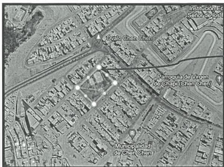
UBICACIÓN DEL PROYECTO